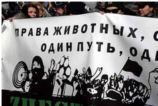
Митинг в защиту бездомных животных в Москве

В январе 2010 года ряд известных российских деятелей культуры, среди которых Елена Камбурова , Сергей Юрский , Инна Чурикова , Валентин Гафт и Андрей Макаревич обратились к властям с предложением о введении поста уполномоченного по правам животных [139][140] . Это обращение вызвало полемику в СМИ [141][142] .