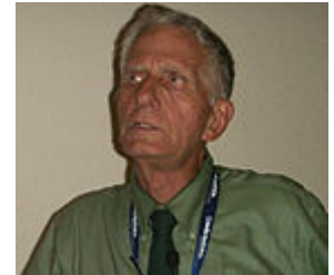
Карл Коэн: животные не способны определить, что этично, а что — нет [127] .

Профессор философии Университета Мичигана в США Карл Коэн выступает против наделения животных личностными характеристиками человека и утверждает, что обладатели прав обязаны уметь находить границу между собственными интересами и тем, что является этичным: „обладатели прав должны осознавать силу обязанностей, которые распространяются на всех, в том числе и на них самих. С их помощью они должны находить возможные конфликты между собственными интересами и тем, что является правильным. Только в сообществе существ, способных на самоограничивающие моральные суждения, может корректно функционировать концепция права“ [127] .