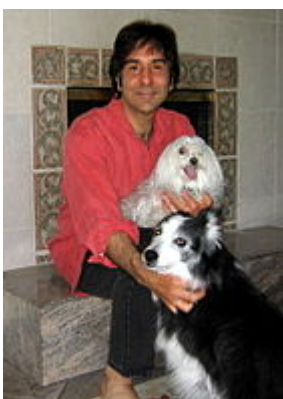
Гэри Франсион: животным нужно только одно право — право не быть чьей-то собственностью.

Аболиционисты придерживаются правового подхода, однако призывают законодательно закрепить за животными только одно право — право не быть чьей-то собственностью [108] . Они считают, что запрет брать в собственность чувствующих существ, может стать ключевым решением для уменьшения страданий животных. Наиболее известный представитель движения — профессор права и философии Ратгерского факультета права Гэри Франсион [124] . Он утверждает, что фокусирование на « благополучии животных » может в действительности только ухудшить положение животных, так как укрепляет собственнический взгляд на них, и дает обществу возможность спокойно использовать [108] .