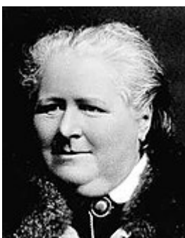
Фрэнсис Пауэр Кобб основала первое в мире общество против вивисекции.

Первая зоозащитная организация США ( Американское общество по предотвращению жестокости к животным , ASPCA) была основана Генри Бергом в апреле 1866 года. До этого Берг получил от президента США Авраама Линкольна назначение на дипломатический пост в России и был поражен жестоким обращением с животными. По возвращении в США, проконсультировавшись в Лондонском RSPCA, он начал выступать против травли быков, петушиных боев и жестокого обращения с лошадьми. Берг создал «Декларацию прав животных» и в 1866 году убедил законодательно принять её в штате Нью-Йорк, а также наделить ASPCA полномочиями для контроля за её исполнением [49] .