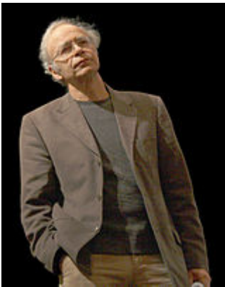
Питер Сингер — сторонник утилитаризма, а не теоретик права.

Сингер придерживается концепции утилитаризма действия — судит о правоте поступка по его последствиям: как повлиял поступок на существ, на которых был направлен; максимизировал ли удовольствие, минимизировал ли боль [17] .