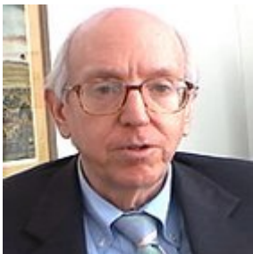
Ричард Познер: «равенство основывается только на фактах». [128]

Судья апелляционного суда седьмого округа США Ричард Познер участвовал в дебатах о правах животных с Питером Сингером на страницах интернет-журнала Slate [128] . Познер утверждает, что его моральная интуиция подсказывает, что люди в опасных ситуациях «предпочитают себе подобных. Если собака нападет на человеческого ребёнка, даже если придется причинить ей больше боли, чем она сама может причинить, тем не менее мы выберем сторону ребёнка. Было бы чудовищно пощадить собаку».