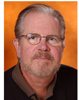
Том Реган: животные — „субъекты жизни“ и поэтому обладают правами.

Животные обладают „неотъемлемой ценностью“ как „субъекты жизни“, считает Реган. И поэтому не могут рассматриваться, как средство для достижения чьих-то целей. Его теория не распространяется на всех чувствующих существ, но только на тех, кого можно считать „субъектами жизни“. По мнению Регана, все здоровые млекопитающие старше, как минимум годовалого возраста, — это „субъекты жизни“ и обладают „естественными правами“ [122][123] . Если Сингер в основном сконцентрирован на улучшении обращения с животными и признает, что в некоторых гипотетических сценариях, отдельных животных можно законно использовать для достижения определенных целей существ как человеческой, так и нечеловеческой природы [17] , Реган полагает, что мы должны обращаться с существами нечеловеческой природы так же, как с людьми [122] . Он сторонник строгого Кантианского принципа (который сам Кант применял только к людям) — никого не следует приносить в жертву ради чего-либо [122] .