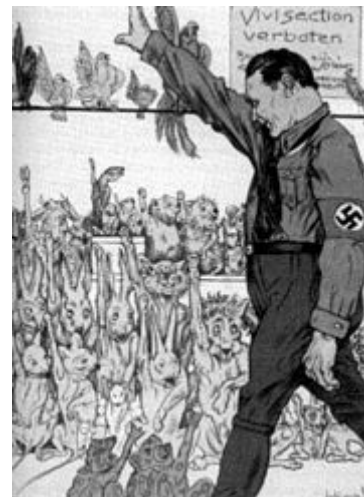
Карикатура, опубликованная в немецком сатирическом журнале Kladderadatsch 3 сентября 1933 года — подопытные животные салютуют по-нацистски Герману Герингу после ужесточения законодательства об опытах на животных.

Небольшая группа исследователей, в основном из Оксфордского университета, известная сегодня как «оксфордская группа», пришла к убеждению, что усиление использования животных представляет собою неприемлемую эксплуатацию [73] . В 1964 году Рут Гаррисон раскритиковала фабрики-фермы в своей известной книге «Животные-