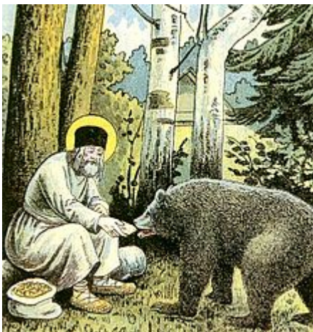
Серафим Саровский кормит дикого медведя (1903)

Вскоре Ричард Мартин и несколько членов парламента ( Сэр Джеймс Макинтош , Сэр Томас Бакстон , Уильям Уильберфорс и Сэр Джеймс Грейам ), обнаружив, что судьи не принимают новый закон всерьёз, и в целом он не соблюдается, решили создать специальное общество для контроля за его исполнением [38] . Оно было создано в 1824 году и получило название « Общество для предотвращения жестокого обращения с животными » (SPCA сокр. от Society for the Prevention of Cruelty to Animals). Во время своего первого заседания в популярном среди актёров и художников Лондонском кафе «Старая скотобойня» они решили устраивать инспекции скотобоев и лондонского Смитфилд (рынок) , где скот продавался ещё с X века, а также контролировать обращение ямщиков с лошадьми [38] . В 1840 году SPCA получило грамоту от королевы Виктории (ярой противницы вивисекции ) и стало королевским (Royal SPCA, RSPCA) [45][46] .